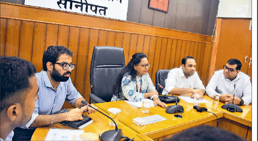
सोनीपत। अधिकारियों के साथ बैठक करती संयुक्त सचिव।

जल शक्ति अभियान के अंतर्गत किए गए कार्यों की समीक्षा करने के लिए कृषि एवं किसान कल्याण मंत्रालय, भारत सरकार के संयुक्त निर्देशक एवं जल शक्ति अभियान जिला सोनीपत की सैटरल नोडिल ऑफिसर एस रुकमनी ने शुक्रवार को लघु सचिवालय में अधिकारियों के साथ बैठक की। यमुना घाट का दौरा करने के बाद बैठक में जल शक्ति अभियान से जुड़े विभागों के अधिकारियों के साथ बैठक कर उन्हें दिशा-निर्देश दिए। उन्होंने कहा कि सभी विभाग आपसी तालमेल के साथ कार्य करते हुए जल शक्ति अभियान के अंतर्गत दी गई जिम्मेदारियों को समयबद्ध पूरा करें। जिलेभर में वर्षा जल संचय को लेकर आमजन को जागरूक करें, क्योंकि जल संरक्षण में हर व्यक्ति की सक्रिय भागीदारी जरूरी है। ऐसे में कैच दा