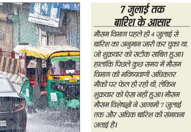
गिता भवन आरओबी से बारिश के बीच गुजरते वाहन।

इस बीच मौसम में आए बदलाव पर कृषि विशेषज्ञों का कहना है कि यह बारिश खरीफ की फसलों, विशेषकर धान, बाजरा और मक्का के लिए बेहद लाभकारी सिद्ध होगी। उमस भरे मौसम के कारण पौधों को जो नुकसान हो सकता था, वह बारिश से संतुलित हो गया है। कृषि विशेषज्ञों के अनुसार, अगर इसी तरह अगले कुछ दिन अच्छी बारिश होती रही तो फसलों की गोथ बेहतर होगी और किसानों को सिंचाई पर अतिरिक्त खर्च नहीं करना पड़ेगा। इकट्ठा ही था। दूसरी ओर बारिश की वजह से किसानों के चेहरे खिल गए हैं। क्योंकि इस बारिश को फसलों के लिये बेहद आवश्यक माना जा रहा है। मानसून की यह बारिश दो तीन दिन और जारी रह सकती है।