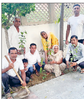
सोनीपत। पौधारोपण करते हुए फाउंडेशन के पदाधिकारी एवं अन्य।