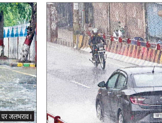
गिता भवन आरओबी से बारिश के बीच गुजरते वाहन।

हवा निकाल दी, जिसमें जिले की सभी ड्रेन और नालों की सफाई का काम पूरा होना बताया गया था। सोनीपत शहर में विशेषतौर पर लगभग हर चौक चौराहा, हर गली मोहल्ले से लेकर पोशा इलाकों तक में जलभराव हो गया। जिसके कारण लोग घरों में कैद रहे। वहीं कई कॉलोनियों में लोगों के घरों में भी पानी घुस गया। देर शाम समाचार लिखे जाने तक बारिश तो रुक गई थी, लेकिन सड़कों पर बारिश का पानी