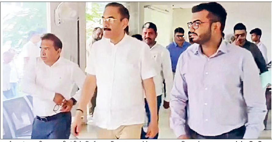
गन्नाौर। अंतरराष्ट्रीय बागवानी मंडी के निर्माण कार्यों का जायजा लेते मुख्य प्रधान सचिव राजेश खुल्लर।