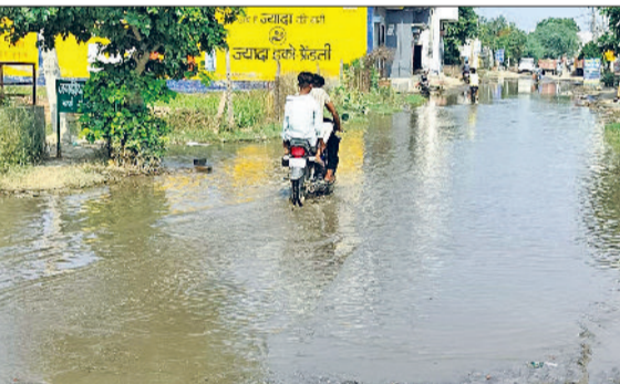
गन्नीौर। लालागढ़ी रोड पर भरे पानी से होकर गुजरते वाहन चालक।