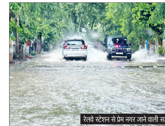
रेलवे स्टेशन से प्रेम नगर जाने वाली सड़क पर जलभराव।

जिले में शुक्रवार को मौसम ने लोगों की कड़ी परीक्षा ली। पहले तो सुबह से ही निकली कड़ी धूप और उमस ने दोपहर तक लोगों का पसीना निकाले रखा। इसके बाद शाम के समय अचानक से मौसम बदला और आसमान में बादल छा गए। जिसके बाद तकरीबन 1 घंटे तक जमकर बारिश हुई। बारिश की वजह से गर्मी से तो राहत मिल गई, लेकिन सड़कों पर इतना पानी जमा हो गया कि लोगों को निकलना दुभर हो गया। जो लोग अपने वाहनों के साथ सड़कों पर निकले उनमें से ज्यादातर के वाहन खराब हो गए। जलभराव ने नगर निगम और प्रशासन के उन दावों की भी